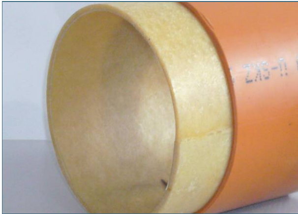
Abb. 5: Egal ob ein kleiner Schaden mit einem Kurzliner oder die ganze Leitung mit einem Schlauchliner saniert wird, es entsteht immer ein (neues) Rohr im (alten) Rohr.

Kurzliner sind vorgefertigte Schlauchstücke aus Glasfasergewebe oder Nadelfilz. Sie sind mit einem sogenannten Reaktionsharz getränkt und werden mit einem Roboter – dem Packer – bis zur Schadensstelle gebracht. Vor Ort presst der Packer den etwa einen halben Meter langen Schlauch an die Leitungswand und verklebt ihn mit dieser. Ist das Harz ausgehärtet, wird der Packer wieder entfernt.