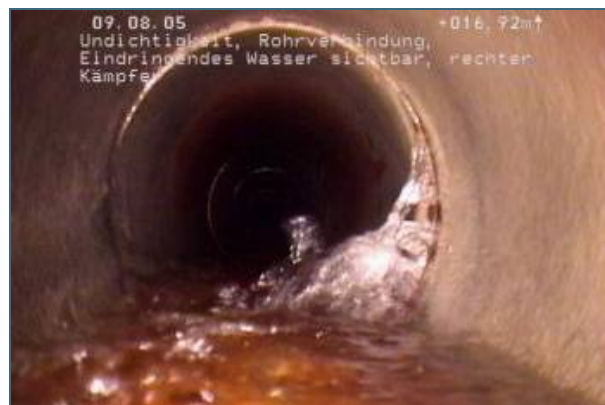
Abb. 4: Wenn aber Grundwasser in die Leitung eindringt, muss schnell gehandelt werden. Hier ist die Sanierungspriorität sehr hoch.

Mit der Inspektionsfirma sollte vor Auftragsvergabe geklärt werden, ob sie auch eine Klassifizierung und Bewertung der Schäden nach DIN 1986-30 (Anhänge A und B) durchführen kann. Bei großen Grundstücksentwässerungsanlagen (z. B. bei Schulen und Kasernen), Leitungsdurchmessern über 250 mm und Anlagen mit großem Sanierungsbedarf ist es empfehlenswert, die genaue Bewertung und die anschließende Sanierungsplanung an ein fachlich geeignetes Ingenieurbüro zu vergeben.