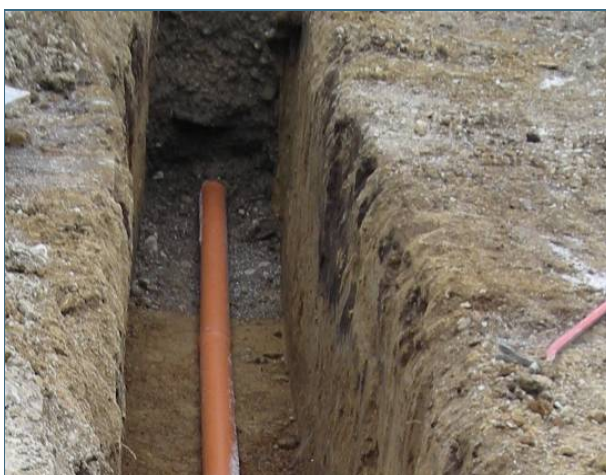
Abb. 6: Wenn eine Abwasserleitung erneuert werden muss, ist es sinnvoll, sie mit wenigen Bögen zu verlegen. So kann sie in Zukunft leichter geprüft werden.

Wenn eine Abwasserleitung so stark beschädigt ist, dass sie z. B. teilweise eingestürzt ist oder die anfallende Abwassermenge nicht mehr fasst, ist es sinnvoll, eine neue Leitung zu verlegen. Die Neuverlegung in offener Bauweise bietet sich an, wenn die Leitungen nicht besonders tief im Erdreich verlegt sind und der Raum über der Leitung nicht überbaut oder hochwertig versiegelt ist. Wichtig ist, dass die offene Baugrube die Standsicherheit des Gebäudes oder umstehender Bäume nicht gefährdet.