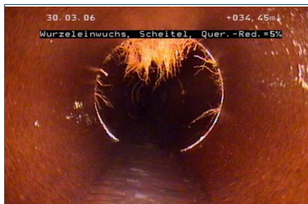
Abb. 3: Wurzeln, die in die Abwasserleitung einwachsen, müssen entfernt werden, sonst verstopft die Leitung. In diesem Beispiel ist die Sanierungspriorität mittel bis hoch.

Zum Ergebnis der optischen Inspektion gehören auch die Auflistung der Schäden und deren Bewertung im Hinblick auf die Sanierungspriorität. Dabei werden drei Prioritäten unterschieden: „keine oder sehr gering“, „gering bis mittel“ und „hoch bis sehr hoch“.