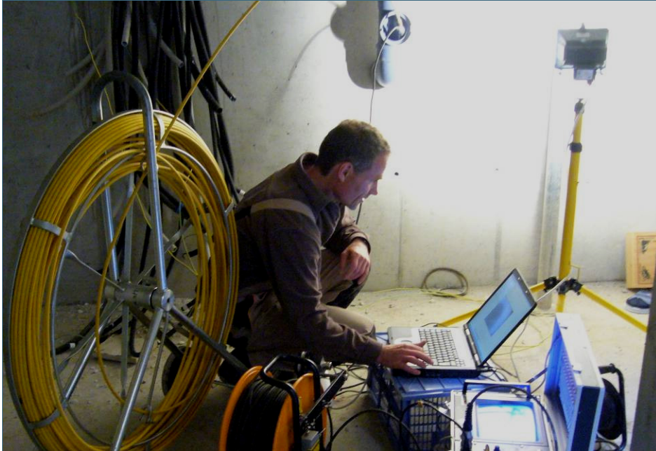
Abb. 2: Ohne Baustelle und Dreck wird bei einer optischen Inspektion die Kamera z. B. über eine Revisionsöffnung im Keller in die Abwasserleitung geschoben.

in die Grundleitung geschoben. Speziell ausgerüstete Kameras können auch in weitere Abzweige vorgeschoben werden. Vor der optischen Inspektion werden die Abwasserleitungen mit Hochdruck-Spüldüsen gereinigt. Diese werden auch über Revisionsschächte oder Reinigungsöffnungen eingeschoben und entfernen lose Verschmutzungen und Ablagerungen.